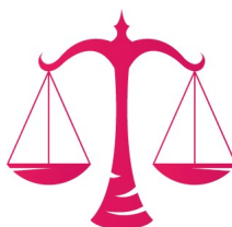
Teha ise otsuseid