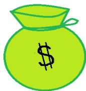
Omada tööd ja raha