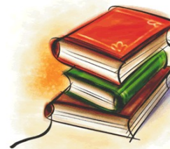
Õppimine ja enesetäiendamine