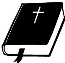
Usk ja religioon