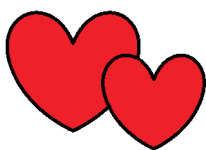
Armastada ja olla armastatud

Paljud konfliktiolukorrad võimenduvad väärtuste erisuse ja erisuste mitteastumise tõttu. Pole olemas õigeid ega valesid väärtusi, on isiklikud väärtused antud ajaperioodil ja teadmine, et need võivad ajas muutuda. Inimene hindab neid ümber vaid loomulikus arengus või murdelistel hetkedel. Kui kellegi väärtused on täielikult vastandlikud teistega võrreldes ja tekitavad probleeme ka talle endale, siis on mõistlik väärtustest rääkida argumentide abil.“